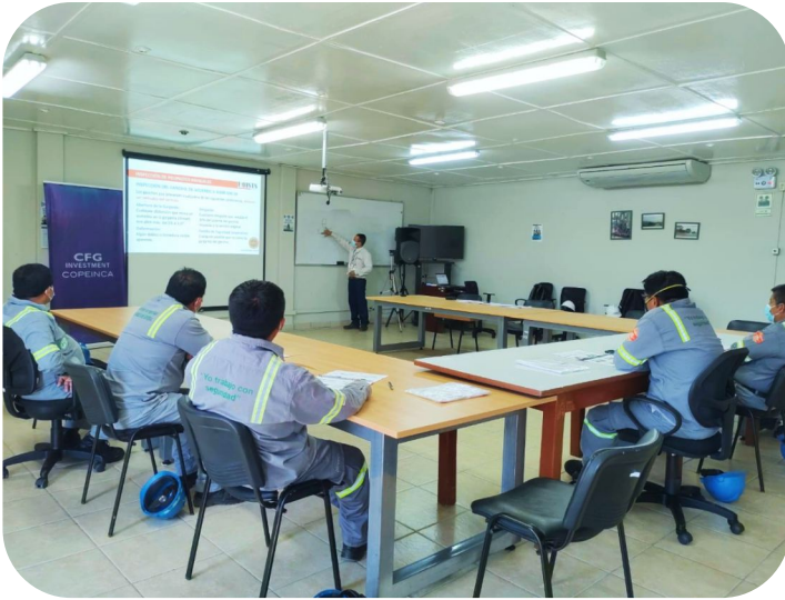
Capacitación de Operador de Punto Grúa, Camión Grúa, Winches y equipos de izaje